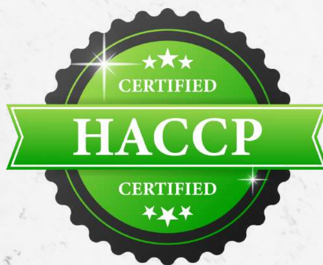
Hazard Analysis Critical Control Point (HACCP)